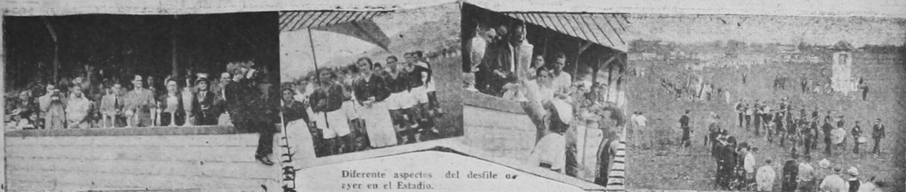
Diferentes aspectos del desfile ayer en el Estadio.